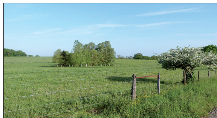
HappyGrass, une application utile pour la gestion du pâturage.

- D. P. : «Une bonne gestion du pâturage commence par un bon