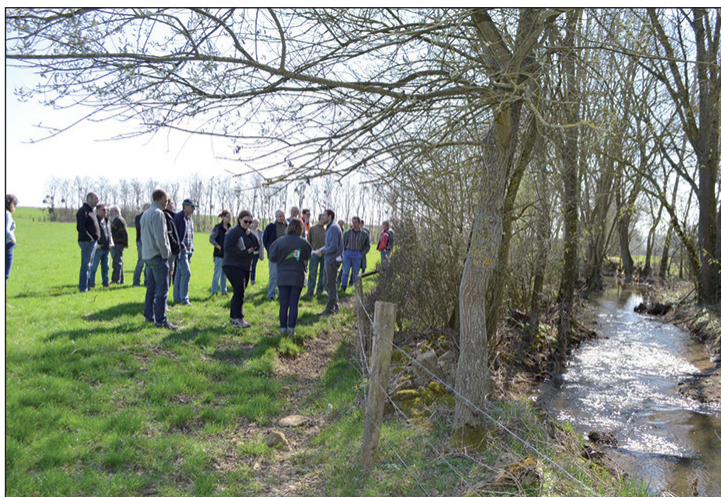
L'évaluation AgriMieux : une étape cruciale pour l'avenir des opérations.

Comme l'impose le cahier des charges tous les quatre ans, les opérations AgriMieux mosellanes sont actuellement évaluées. Il s'agit d'une étape cruciale qui offre un aperçu des changements de pratiques et progrès réalisés par les exploitants du bassin versant de la Seille et de la Nied dans l'unique objectif de limiter l'impact de l'agriculture sur la qualité de l'eau.