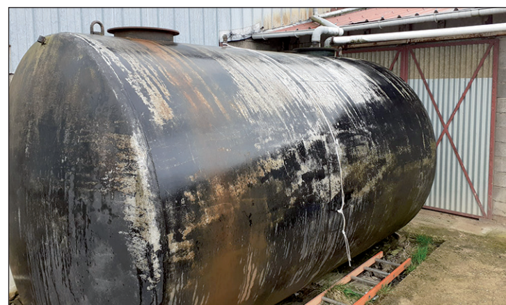
Cuve de récupération des eaux pluviales à Saint-Jure.