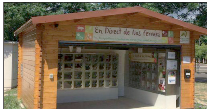
Trois lieux ont été retenus sur l'Eurométropole de Metz.

Sur le principe d'un magasin de producteurs, c'est un collectif