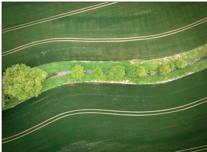
La présence d'une bande tampon de 5 mètres de large minimum est obligatoire le long des cours d'eau BCAE.

Cette nouvelle mesure ne sera applicable qu'à partir de 2024. Elle fixera des pratiques interdites sur les zones humides. Le