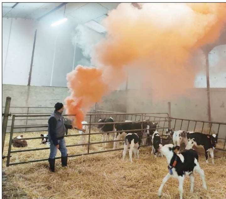
«La ventilation des bâtiments d'élevage est devenue un point incontournable au bien-être des animaux et des éleveurs.»

La ventilation des bâtiments d'élevage est devenue depuis quelques années un point incontournable au bien-être des animaux et des éleveurs. La réalisation d'un diagnostic d'ambiance permet d'améliorer la santé et la