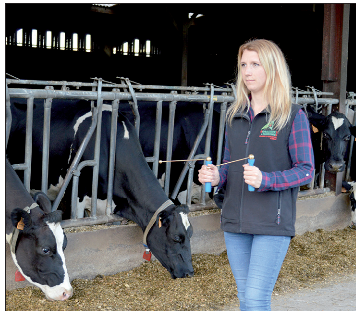
«La géobiologie permet de résoudre les perturbations liées au courants parasites et au sous-sol.»

rité chaque occupant pour optimiser leur bien-être et leur santé». En élevage, elle permet de résoudre les perturbations liées au courants parasites et au sous-sol, qui peuvent impacter négativement la santé des animaux (mortalité, baisse de production, problèmes de fertilité) et générer