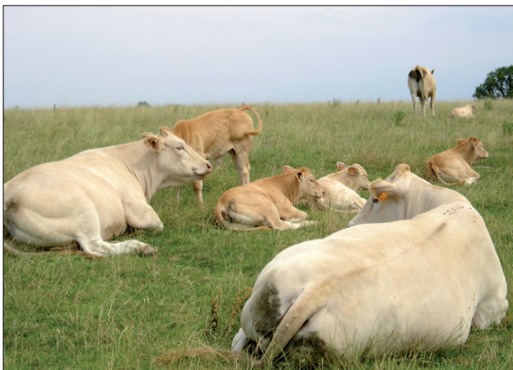
La sélection des génisses va se faire soit sur une base d'observation de l'éleveur ou du pointeur, soit sur une base chiffrée, soit sur une base d'indexation.

La sélection des génisses va se faire, soit sur une base d'observa-