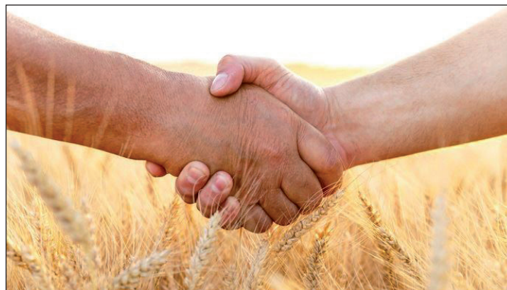
Maintenir sa rentabilité est important pour une meilleure transmission de son exploitation.

Elle passe notamment par la maîtrise du foncier. Réussir à rendre sa surface exploitée accessible à son repreneur est également en lien avec la gestion des investissements avant transmission. Les besoins