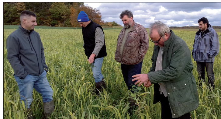
Le groupe PADEM se retrouve à l'occasion de tours de plaine, l'occasion d'échanges enrichissants.

- IFT Hors Herbicides : moyenne de 1.50 pour un objectif de 2.4. L'objectif final à 3 ans est même déjà atteint. Toutes les exploitations ont atteint l'objectif 2020, même celles qui étaient au-delà