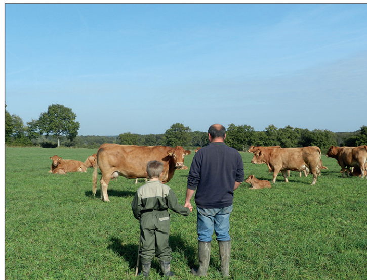
La cession d'exploitation souvent synonyme du fruit de toute une vie doit être anticipée et réfléchie.

Plusieurs outils sont à votre disposition afin de préparer votre vie nouvelle, comme faire un point grâce à votre relevé de carrière et l'estimation de votre retraite. Il est également important de