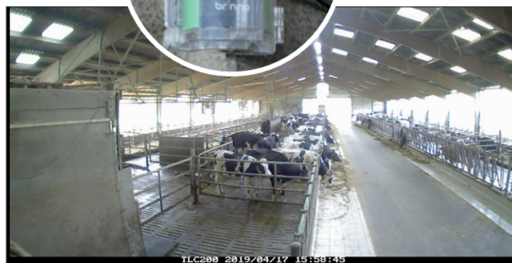
Image issue de l'enregistrement de la caméra