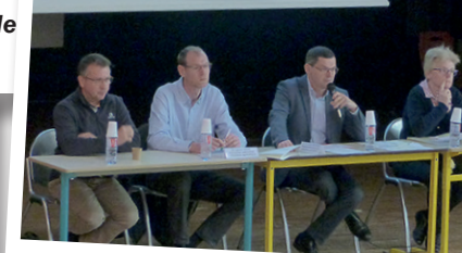
La Chambre d'agriculture a rassemblé les acteurs de la filière pour une information complète sur la production d'œufs, suite aux questionnements d'agriculteurs.