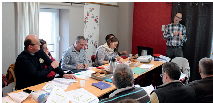
Rencontre du groupe « perspective lait ».