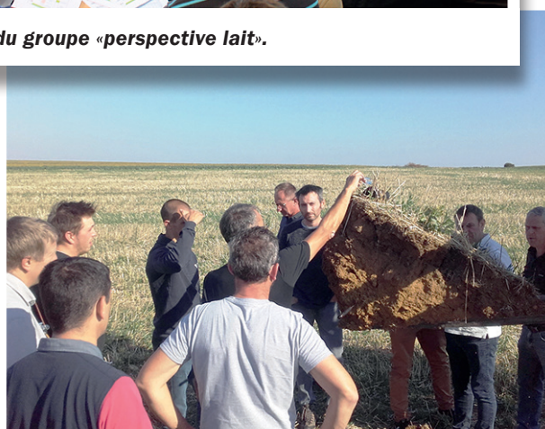
... et travail du sol lors d'une formation dans le Pays Haut.