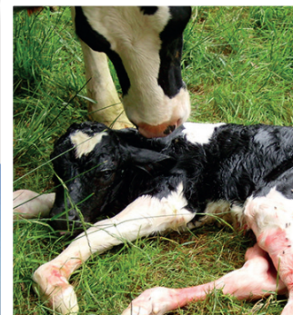
Gestadéctect, test de gestation à partir d'un échantillon de lait, est de plus en plus plébiscité par les éleveurs, adhérents au contrôle laitier ou non, équipés d'un robot ou non. Cet outil permet de réagir vite à une perte potentielle de revenu en réduisant l'intervalle vêlage-vêlage.