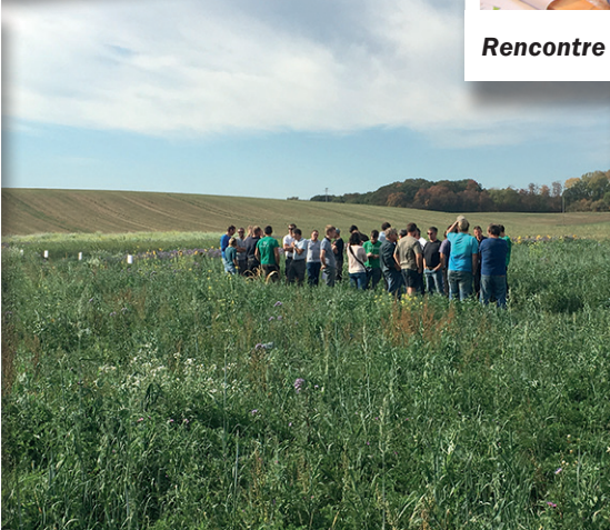
En octobre : visite de la plate forme d'interculture PIEauNieds...