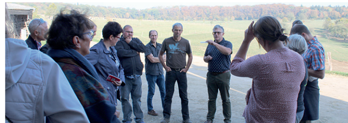
Rencontre annuelle des jeunes suivis par la Chambre d'agriculture : visite en Sarre pour une confrontation des réalités franco-allemandes.