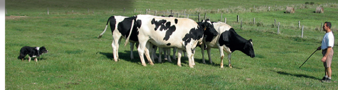
Véritable outil de travail, les formations « chien de troupeau » sont toujours appréciées des éleveurs ovins et bovins.