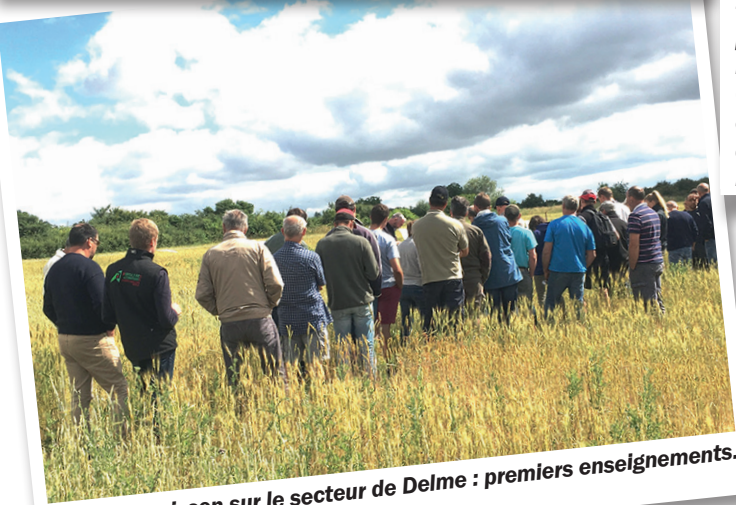
Avant moisson sur le secteur de Delme : premiers enseignements.