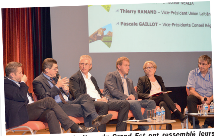
Les Chambres d'agriculture du Grand Est ont rassemblé leurs expertises pour présenter aux polyculteurs-éleveurs du territoire les nouveautés et perspectives des protéines lors d'un colloque organisé à Agrimax.