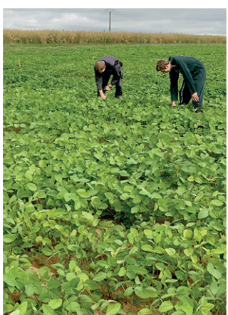
Le 18 juin dans le sud mesin : une nouvelle culture décortiquée : le soja.