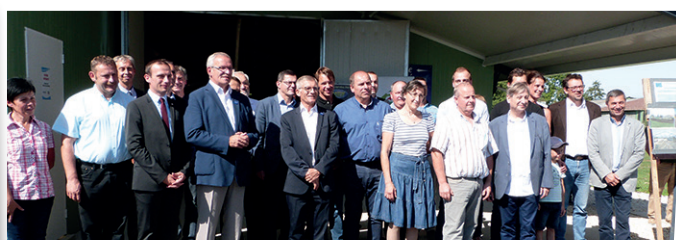
Reconnaissance d'une nouvelle production sous signe de qualité : le poulet noir Label rouge.