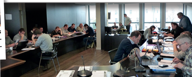
Services élevage et agronomie planchent sur l'autonomie protéique.