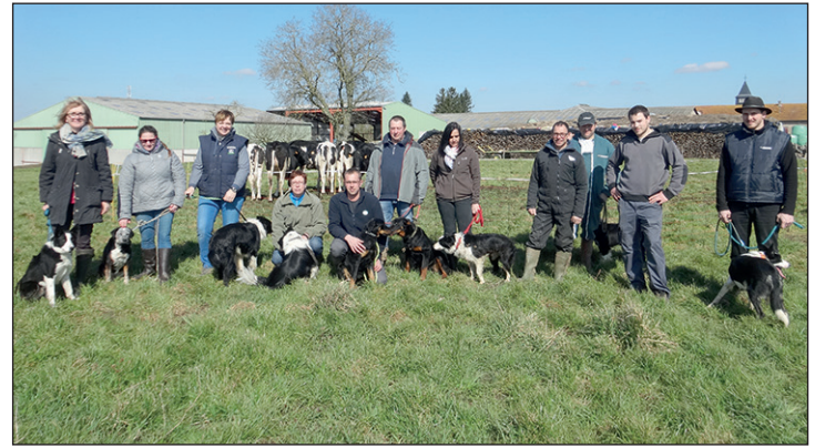
Au cercle, les stagiaires canalisent leur chien pour qu'il s'arrête à l'opposé de leur maître.