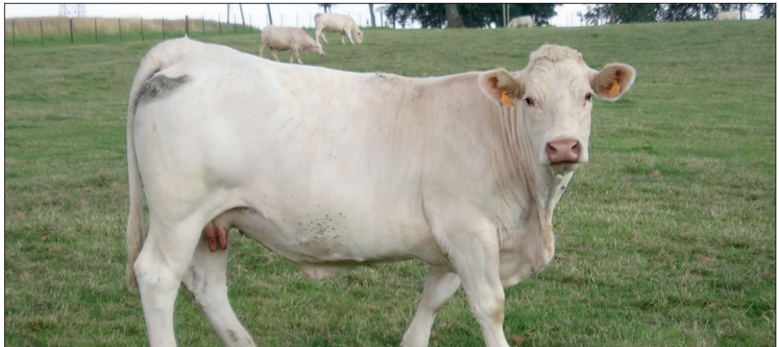
Certains éleveurs font le choix d'une intensification élevée à l'herbe. Pourtant la marge brute n'est pas corrélée avec le chargement.

L'impact sur la marge brute est lié aux charges de concentré et surtout aux charges vétérinaires liées à la reproduction. En effet la qualité des fourrages, récoltés en 2016, valorisés sur l'hiver dernier, a impacté la quantité de concentré achetée et la croissance des