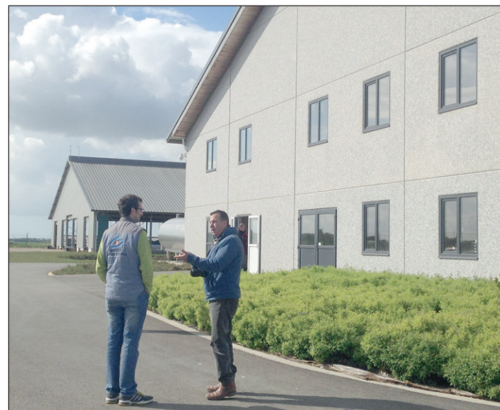
Chaque audit est une analyse sur mesure propre à chaque système.

L'audit doit dresser un état des lieux, mais surtout doit vous donner des pistes pour décider et assumer vos décisions. Le rôle