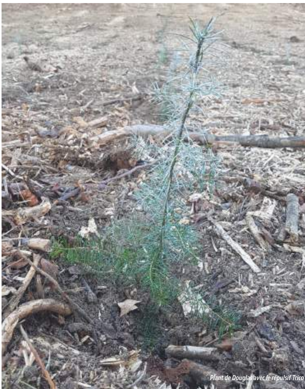
Plant de Douglas avec le répulsif Trico

Depuis le 1 er janvier 2021, les exploitants agricoles, souhaitant renouveler leur certiphyto, devaient jusqu'à maintenant justifier de 2 CSP par intervalle de 5 ans (Conseil Stratégique à l'utilisation des Produits phytosanitaires). Des dérogations, prenant en considération des seuils de surfaces et certains types de cultures, ramenaient cette obligation à 1 CSP tous les 5 ans. Cette mesure faisait suite à la séparation du conseil et de la vente et s'est avérée être une prestation payante supplémentaire imposée et dispensée par certains organismes (dont les Chambres d'Agriculture). Cela n'a pas forcément ravi nos agriculteurs. Quel rapport avec les propriétaires forestiers ? Sachez qu'en 2023, la DRAAF a envoyé aux propriétaires forestiers, qui devaient renouveler leur certiphyto, un courrier en leur rappelant l'obligation de ce fameux CSP ! « Mais... nous n'utilisons que de la graisse de mouton !! » - Il n'y a pas de « Mèèèh » qui tienne... Les récents événements (colère des agriculteurs et opérations de blocages) ont quelque peu changé la donne puisque pour l'heure tout cela semble